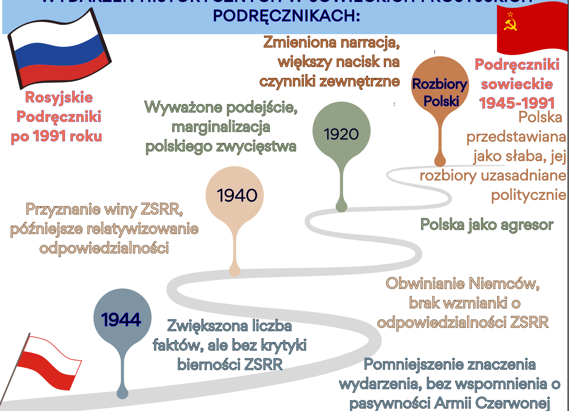
TABELA PORÓWNAWCZA PRZEDSTAWIENIA KLUCZOWYCH WYDARZEŃ HISTORYCZNYCH W SOWIECKICH I ROSYJSKICH PODRĘCZNIKACH: