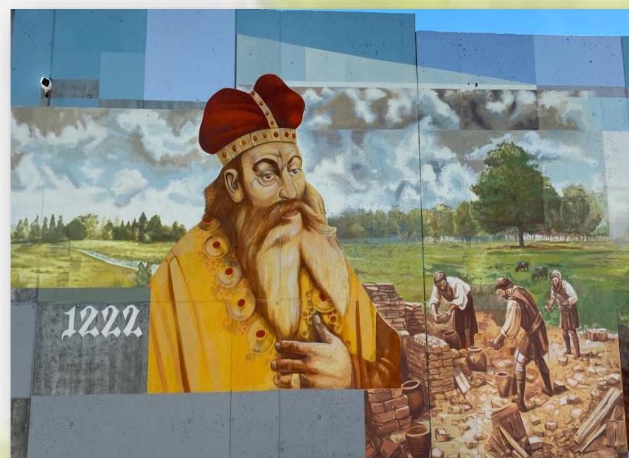
sprowadzenie osadników przez Henryka Brodatego w 1222r.