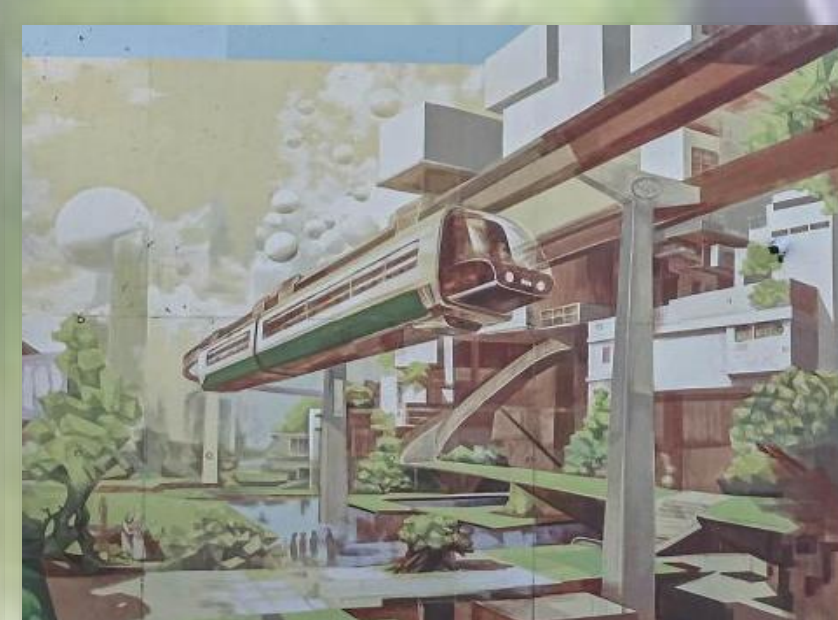
Futurystyczna wizja Zielonej Góry