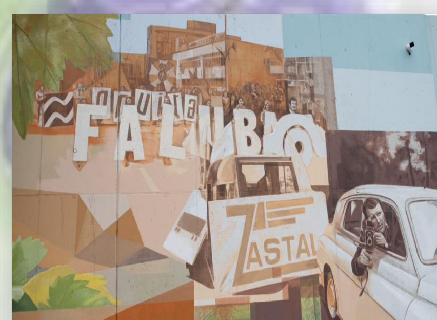
Klub koszykarski Zastal oraz klub żużlowy Falubaz powstałe w 1946 r.; pierwszy raz nazwy Falubaz użyto w 1973 r.