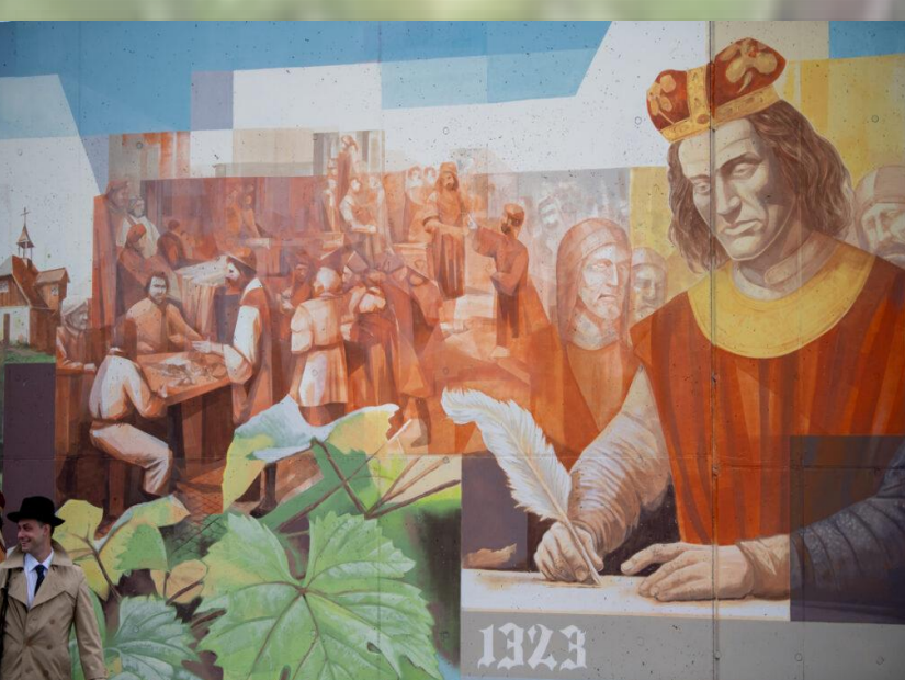
nadanie praw miejskich przez Henryka IV w 1323 r.