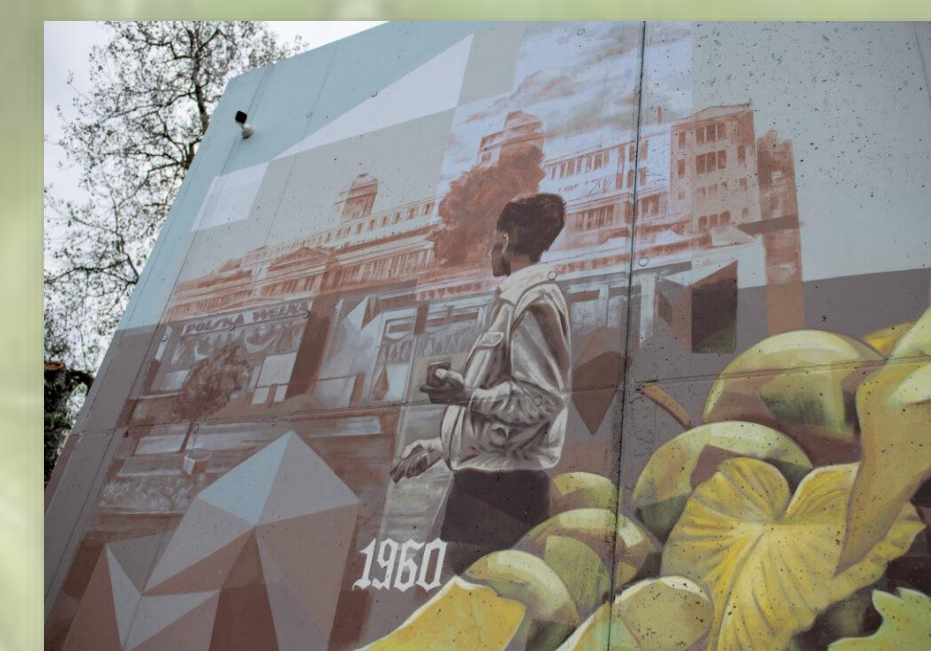
Wydarzenia Zielonogórskie 30 maja 1960 r. Obrona Domu Katolickiego – zryw antykomunistyczny