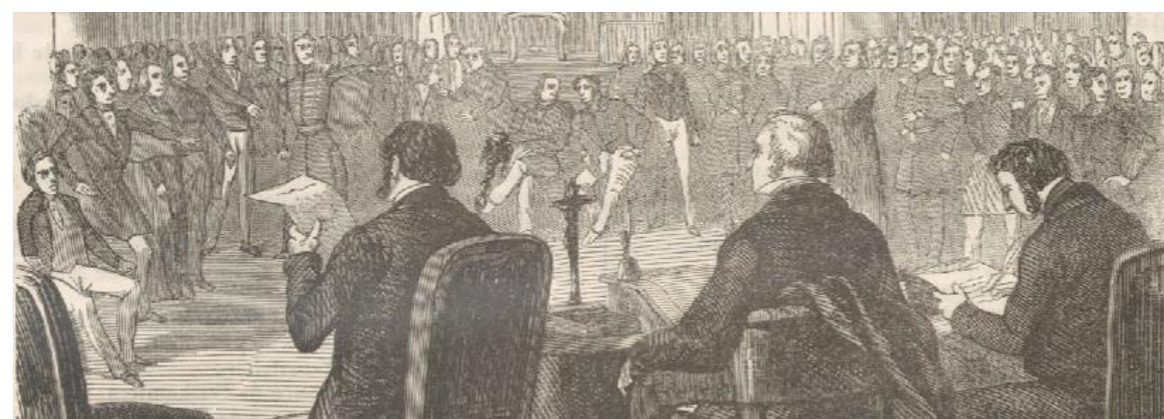
L. Chodźko, Histoire de Pologne , Paris 1855, s.88.

W związku z brakiem ograniczeń w materii tematyki prośb reprezentanci przedkładali petycje w różnorodnych sprawach. Wśród dokumentów można odnaleźć pisma dotyczące kwestii politycznych, prawnych, finansowych, wojskowych, gospodarczych, administracyjnych bądź dotyczących mniejszości. Ten szeroki wachlarz poruszanych w petycjach tematów przekłada się na to, że mogą być one przydatne w niemalże dowolnej materii badań nad okresem istnienia Królestwa Polskiego. Ponadto jednolity układ treści w petycjach (zwrot do monarchy, opis przyczyny złożenia, propozycja zaradzenia problemowi, podpisy), będący, jak sądzę, efektem panującego wówczas zwyczaju legislacyjnego, dostarcza dzięki opisowej formie licznych informacji dotyczących funkcjonowania Królestwa. Kwestia ta łączy się z oddolnością źródła. Wobec dominacji w bazie źródłowej dokumentów pochodzących od władz możliwość skorzystania z materiałów będących, w założeniu, głosem rządzonych umożliwia wyjście poza optykę rządową oraz zapoznanie się z percepcją i oczekiwaniami społecznymi, co czyni możliwym uzyskanie pełniejszego obrazu Królestwa Polskiego.